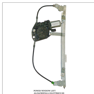
POWER WINDOW LEFT ALZACRISTALLI ELETTRICI SX

Lève-vitre de remplacement / Ersatz-Fensterheber Alzacristalli di ricambio / Elevavinas de recambio