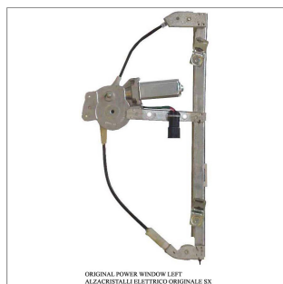
ORIGINAL POWER WINDOW LEFT ALZACRISTALLI ELETTRICI ORIGINALI SX

Lève-vitre d'origine / Original-Fensterheber Alzacristalli originale / Elevavinas original