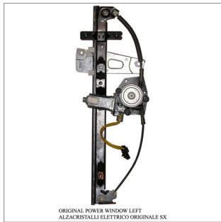
ORIGINAL POWER WINDOW LEFT ALZACRISTALLI ELETTRICI ORIGINALE SX

Lève-vitre d'origine / Original-Fensterheber Alzacristalli originale / Elevavinas original