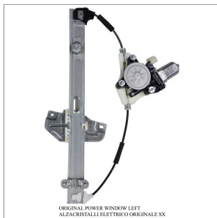
ORIGINAL POWER WINDOW LEFT ALZACRISTALLI ELETTRICI ORIGINALE SX

Lève-vitre d'origine / Original-Fensterheber Alzacristalli originale / Elevavinas original