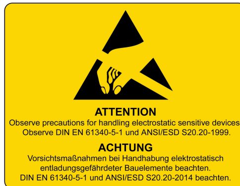
4 - ESD Hinweise / ESD Notes