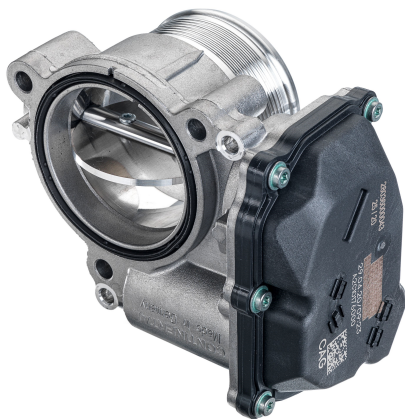
1 - Produkt / Product

Nennspannung (Positionssensor) / Nominal Voltage (Position Sensor) = 5 V