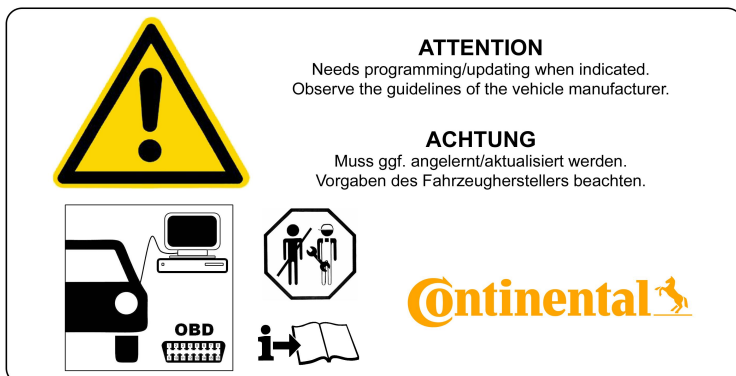
3 - Montage Hinweise / Installation Notes