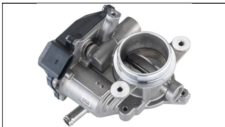
1 - Produkt / Product