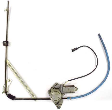
oem window regulator - lève-vitre original - Fensterheber von oem - eleva-lunas original - levantator de vidro original - Γρύλος γνήσιος - alzacrystallo originale