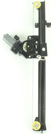
oem window regulator - lève-vitre original - Fensterheber von oem - elevalunas original - levantator de vidro original - Γρύλος γνήσιος - alzacrystallo originale