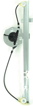
Our window regulator - notre lève-vitre - unser Fensterheber - nuestro elevalunas- nosso levantator de vidro - Γρύλος γνήσιος - nostro alzacrystallo