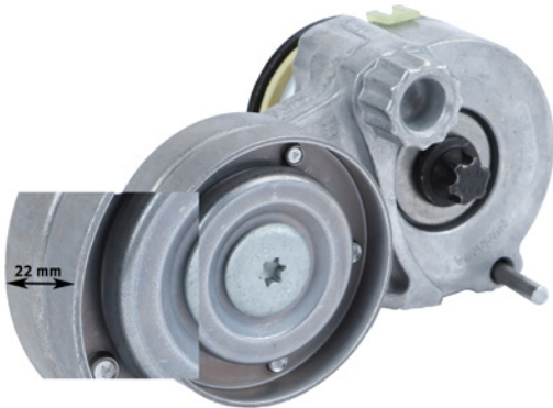
Option A | Variante A | Version A | Variante A | Variante A | Wariant A

Tensioning arm | Spannarm | Bras tendeur | Braccio tenditore | Braço tensor | Rolka prowadząca