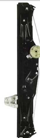
ORIGINAL POWER WINDOW ALZACRISTALLI ELETTRICO ORIGINALE