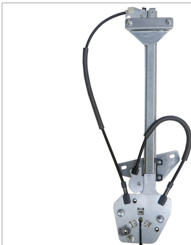
POWER WINDOW RIGHT ALZACRISTALLI ELETTICO DX

THIS INSTALLATION INSTRUCTION IS FOR BOTH LEFT AND RIGHT SIDE. CETTE INSTRUCTION DE MONTAGE EST POUR LES DEUX COTES DROIT ET GAUCHE. DIESE MONTAGE-ANLEITUNG IST FÜR DIE BEIDE LINKE UND RECHTE SEITE. ESTA INSTRUCCION DE MONTAJE ES PARA LOS DOS LADOS IZQUIERDO Y DERECHO. ESTAS INSTRUÇÕES VALEM TANTO PARA O LADO ESQUERDO QUANTO PARA O DIREITO. DEZE AANWIJZINGEN GELDEN VOOR ZOWEL DE LINKER- ALS DE RECHTERKANT. Η ΠΑΡΟΥΣΑ ΟΔΗΓΙΑ ΑΦΟΡΑ ΤΟΣΟ ΤΗΝ ΑΡΙΣΤΕΡΗ ΟΣΟ ΚΑΙ ΤΗ ΔΕΞΙΑ ΠΛΕΥΡΑ. LA PRESENTE ISTRUZIONE VALE SIA PER IL LATO SINISTRO CHE PER IL LATO DESTRO.