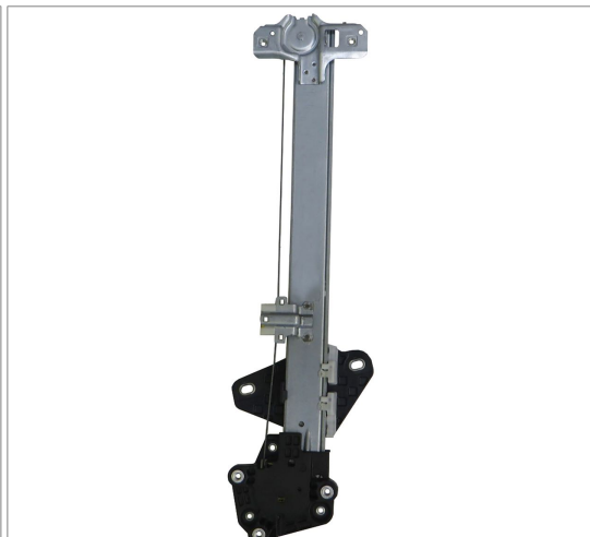
ORIGINAL POWER WINDOW RIGHT ALZACRISTALLI ELETTICO ORIGINALE DX