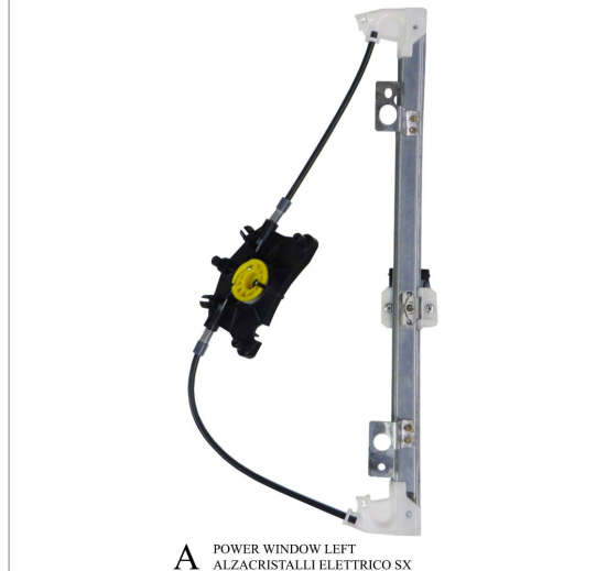
A POWER WINDOW LEFT ALZACRISTALLI ELETTRICO SX

THIS INSTALLATION INSTRUCTION IS FOR BOTH LEFT AND RIGHT SIDE. CETTE INSTRUCTION DE MONTAGE EST POUR LES DEUX COTES DROIT ET GAUCHE. DIESE MONTAGE-ANLEITUNG IST FÜR DIE BEIDE LINKE UND RECHTE SEITE. ESTA INSTRUCCION DE MONTAJE ES PARA LOS DOS LADOS IZQUIERDO Y DERECHO. ESTAS INSTRUÇÕES VALEM TANTO PARA O LADO ESQUERDO QUANTO PARA O DIREITO. LA PRESENTE ISTRUZIONE VALE SIA PER IL LATO SINISTRO CHE PER IL LATO DESTRO.